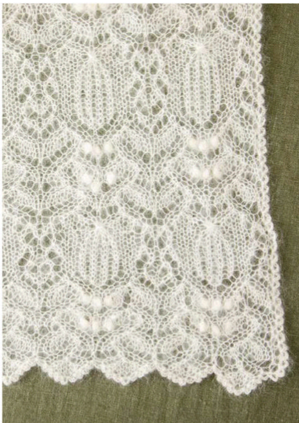
Мягкие фестончатые края набора петель дополнительно подчеркиваются окантовкой из вязаной крючком цепочки, которая окаймляет всю шаль.

в любом углу сделайте накид и протяните лп через ВП, 3 возд. п. *Соед. п. в следующий кромочный ст., 3 возд. п.; повторить от * по всем 4 сторонам, соединить с первым кромочным ст. соед. ст. Закрепить.