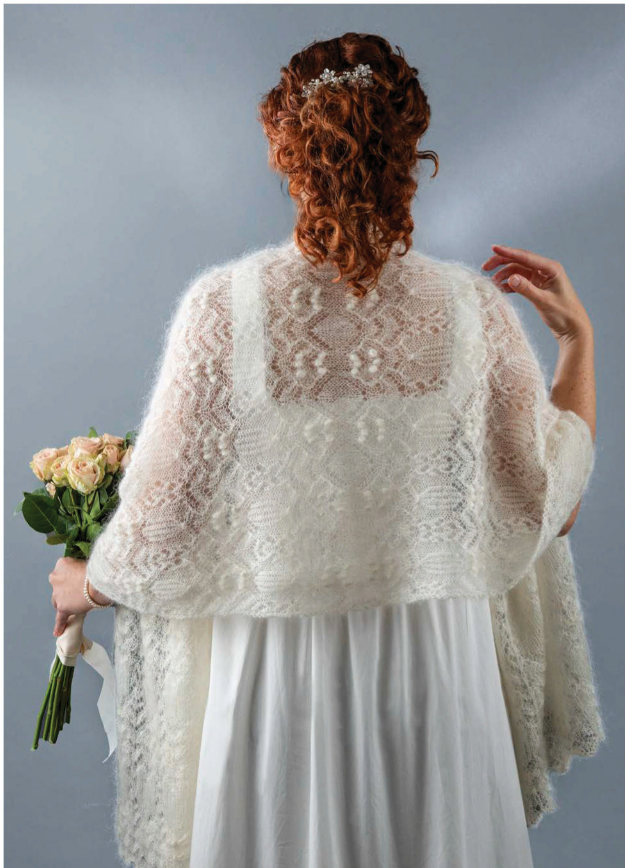
Профессиональная разработка Ширли Паден, сочетающая в себе передвижные и кружевные стежки, выполненные из белоснежной мохеровой и шелковой пряжи, превращает шаль в нечто, достойное героини.