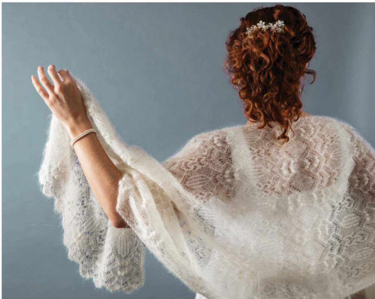
Шаль связана спицами из двух прямоугольников, соединенных вместе по центру спинки.