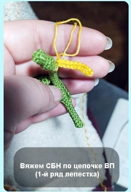
Вяжем СБН по цепочке ВП (1-й ряд лепестка)