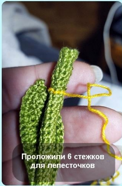
Проложили 6 стежков для лепесточков