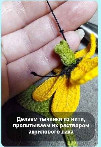
Делаем тычинки из нити, пропитываем их раствором акрилового лака