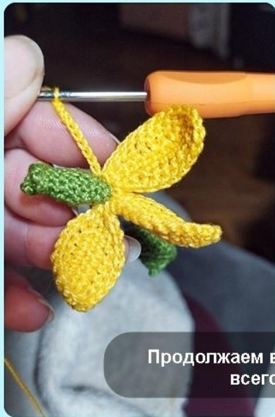
Продолжаем вязать лепестки, всего 6 штук