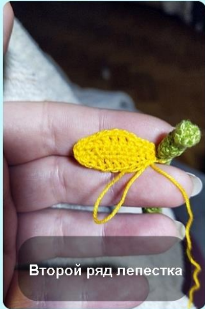
Второй ряд лепестка