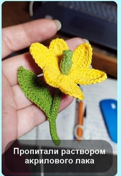
Пропитали раствором акрилового лака