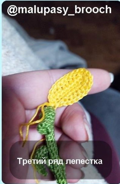
Третий ряд лепестка