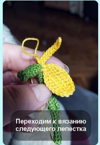
Переходим к вязанию следующего лепестка