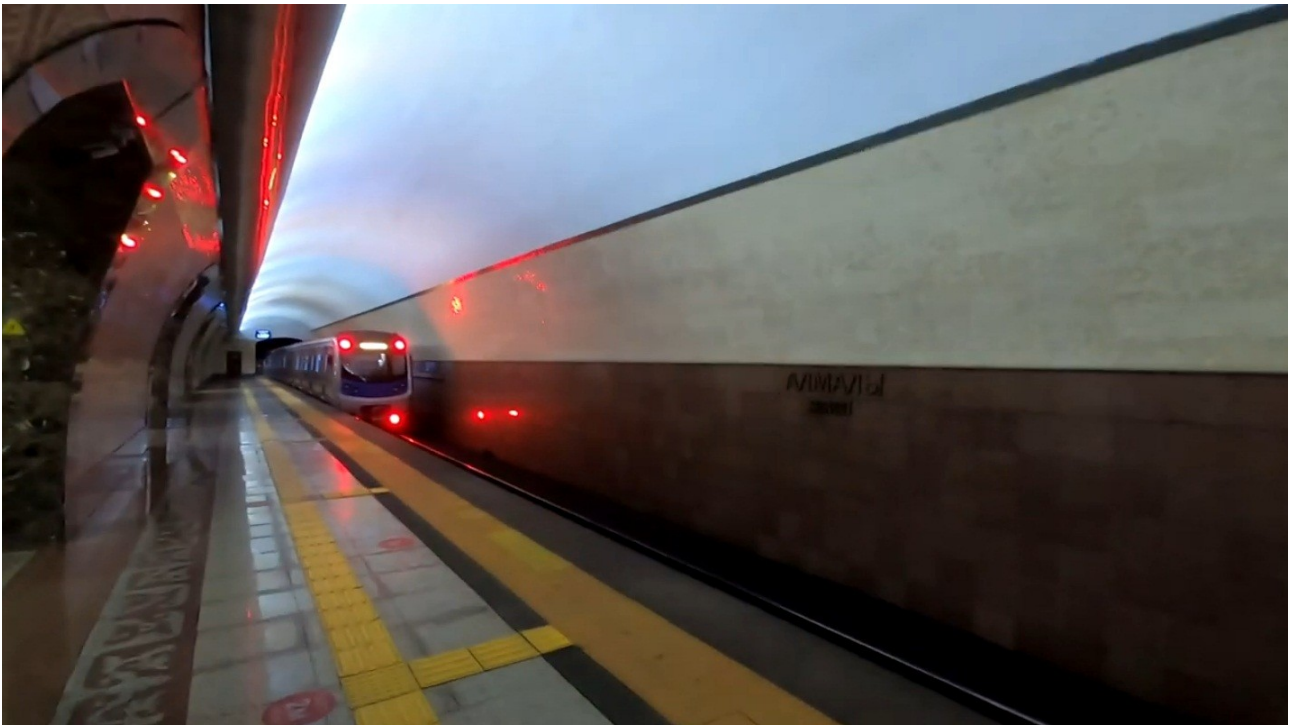
На фото: Метро Алматы. Станция «Алмалы».