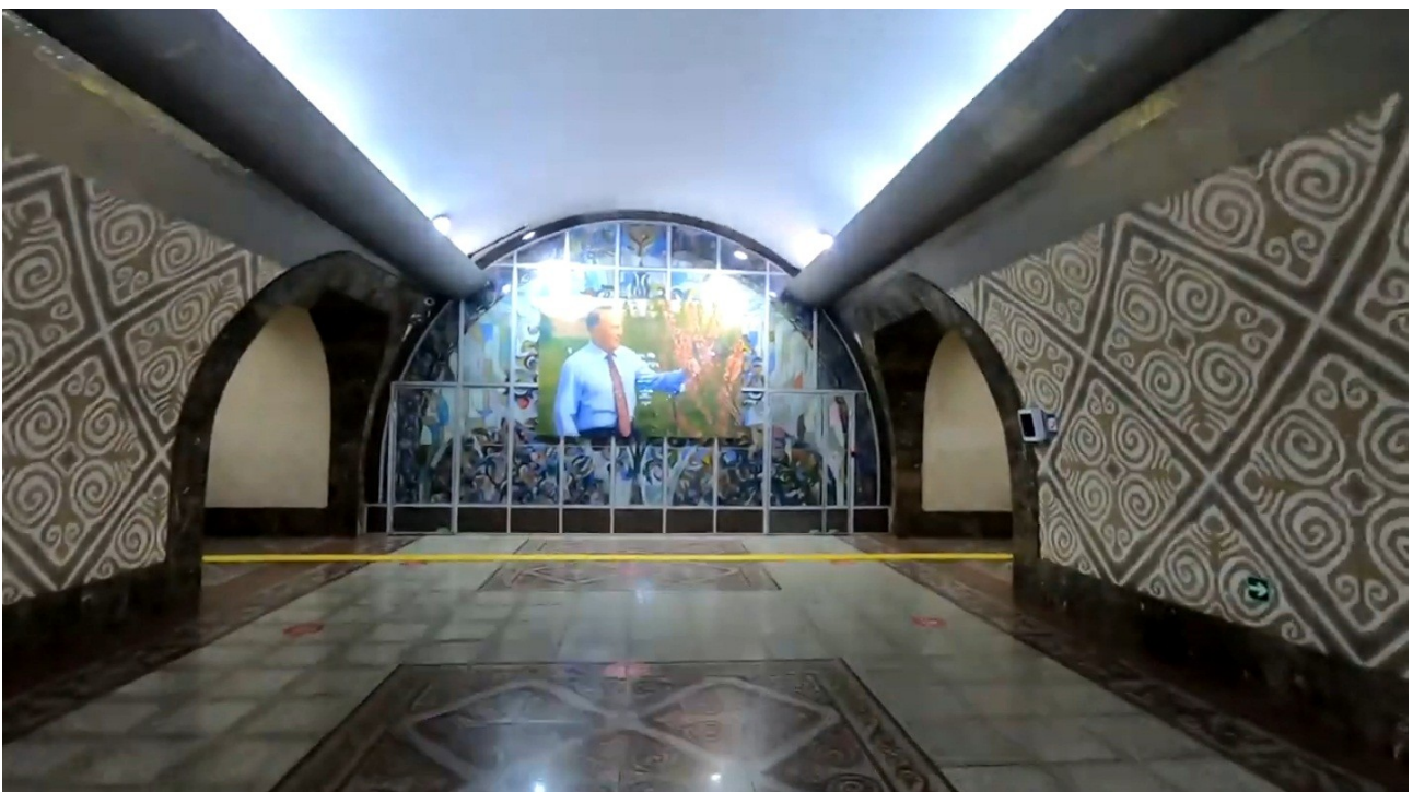
Метро Алматы. Станция «Алмалы».

Естественно, что я смотрю на что-то не как обыкновенный человек, а как йогин, обладающий некоторыми возможностями «ясновидения» (или, иногда, «ясночувствования»).