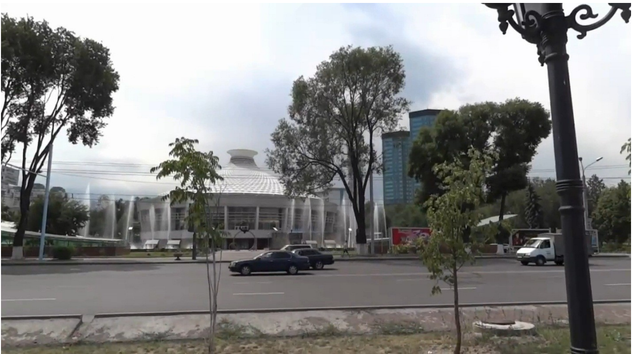
Государственный Цирк на проспекте Абая, 2012 г.