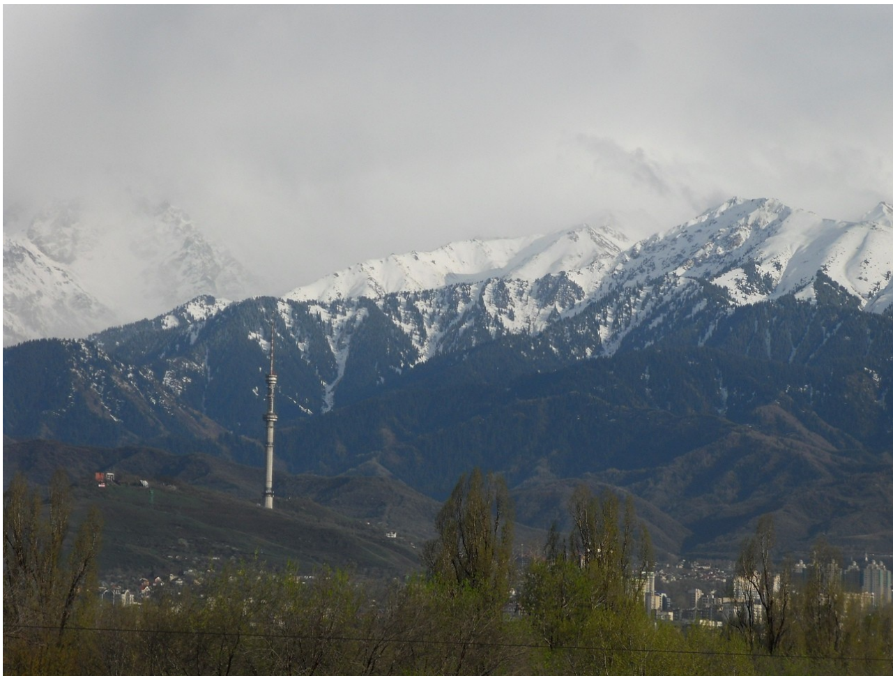
Вид на холмы Көк-Төбе и Алматинскую телебашню, 2017 г.

Как раз сегодня рано утром, во время подготовки этой статьи, я просматривал фотографии моего родного города — Алма-Аты, и моё внимание привлекли холмы Көк-Төбе с находящейся на них телевизионной башней — одного из известнейших символов этого прекрасного города, находящегося в южном Казахстане — в самом сердце Средней Азии.