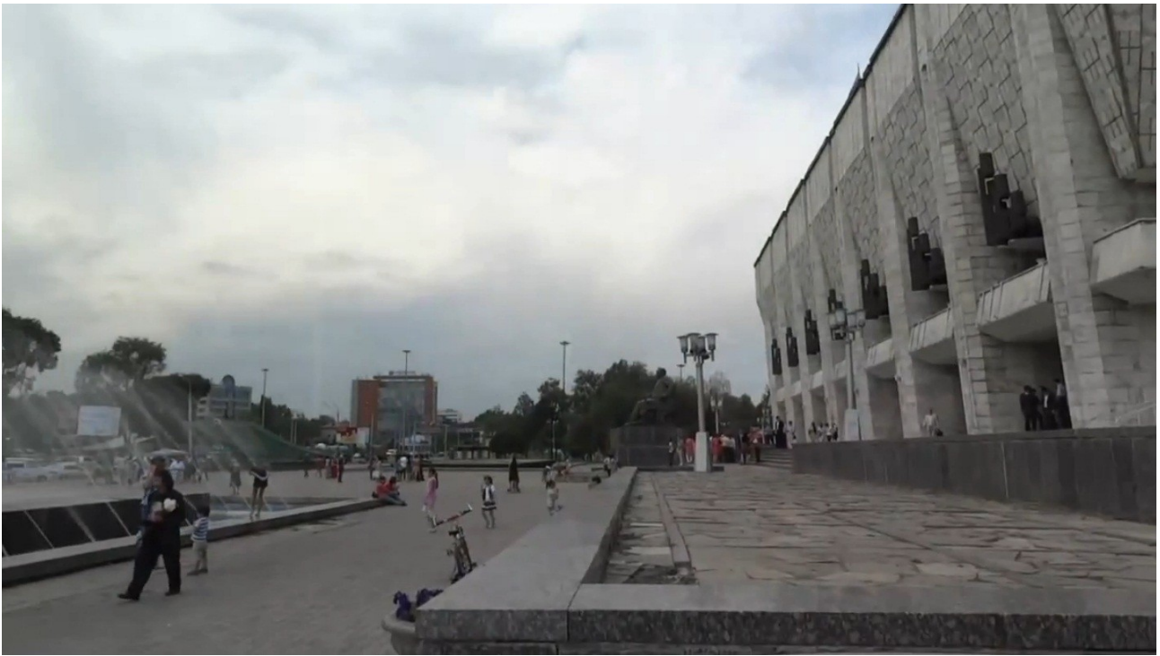
Театр драмы им. Мухтара Ауэзова на проспекте Абая, 2012 г.