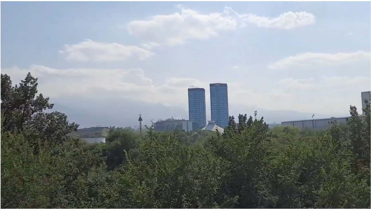
Вид на юго-запад Алматы из окна учебного корпуса «Казахского Университета международных отношений имени Абылай-Хана», лето 2021 г. На снимке заметно здание Цирка и справа — крыша театра им. М. Ауэзова. Также видно, что летом город буквально «утопал» в зелени многообразных деревьев...