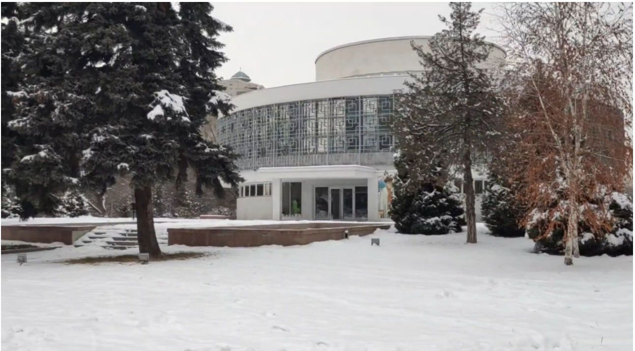
Дворец Бракосочетания в Алматы на проспекте Абая, январь 2023 г.