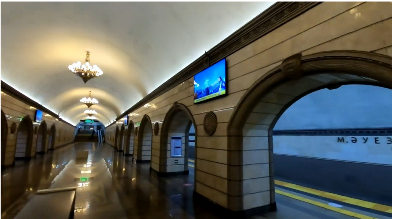
Метро Алматы. Станция «М. Ауезов театры».

Я решил заново просмотреть весь фильм, более внимательно, но каково же было мое изумление и негодование, когда я «увидел», что станция метро внутри, сверху до низу и как бы наискось, полностью загромождена большими массивами грунта — земли и глины! Сначала они выглядели почти кубическими, по ощущению совершенно «свежими» массивами грунта, с квадратный кубометр величиной, с некоторыми пустотами между ними... Мне так показалось, что они будто бы нагромодились внутрь помещения станции прямо сейчас, вот только что перед моими глазами! Особенно это было заметно, когда в видеофильме шла речь о станции «Театр имени М. Ауезова»: