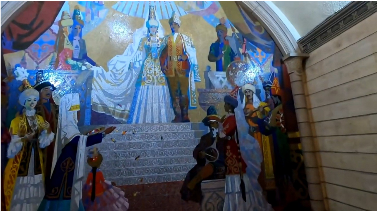
На фото: Метро Алматы. Станция «Театр имени М. Ауезова».

Я решил заново просмотреть весь фильм, более внимательно, но каково же было мое изумление и негодование, когда я «увидел», что станция метро внутри, сверху до низу и как бы наискось, полностью загромождена большими массивами грунта — земли и глины! Сначала они выглядели почти кубическими, по ощущению совершенно «свежими» массивами грунта, с квадратный кубометр величиной, с некоторыми пустотами между ними... Мне так показалось, что они будто бы нагромодились внутрь помещения станции прямо сейчас, вот только что перед моими глазами! Особенно это было заметно, когда в видеофильме шла речь о станции «Театр имени М. Ауезова»: