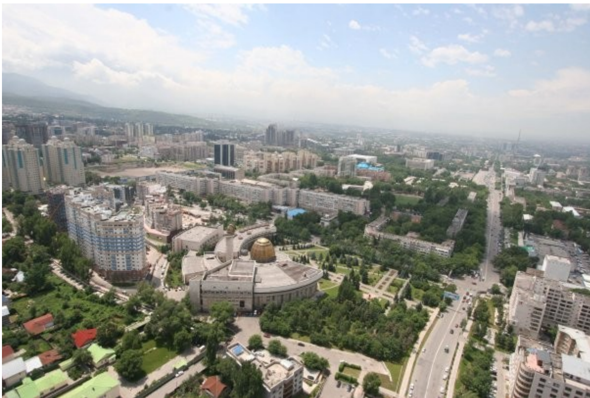
На фото: Дворец Пионеров с обсерваторией, 2007 г.