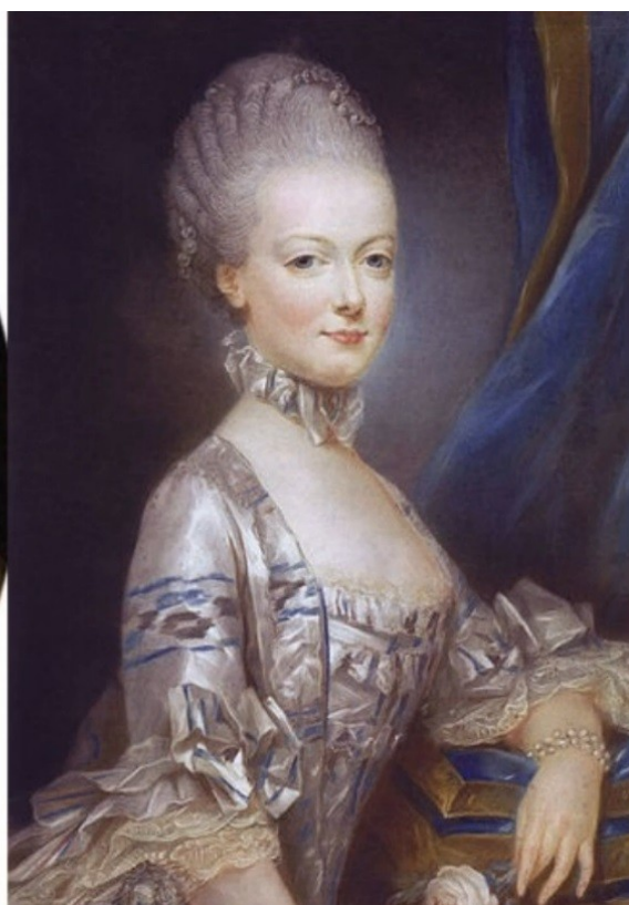
На фото: Король Франции Людовик XVI и его супруга — Мария Антуанетта.