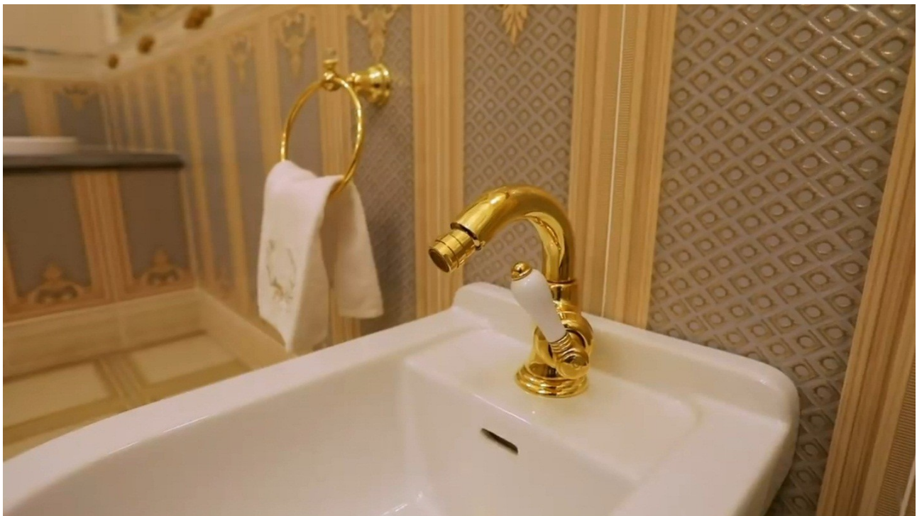
На фото: Золотое убранство ванной комнаты и туалета — элитная резиденция в Алма-Ате.