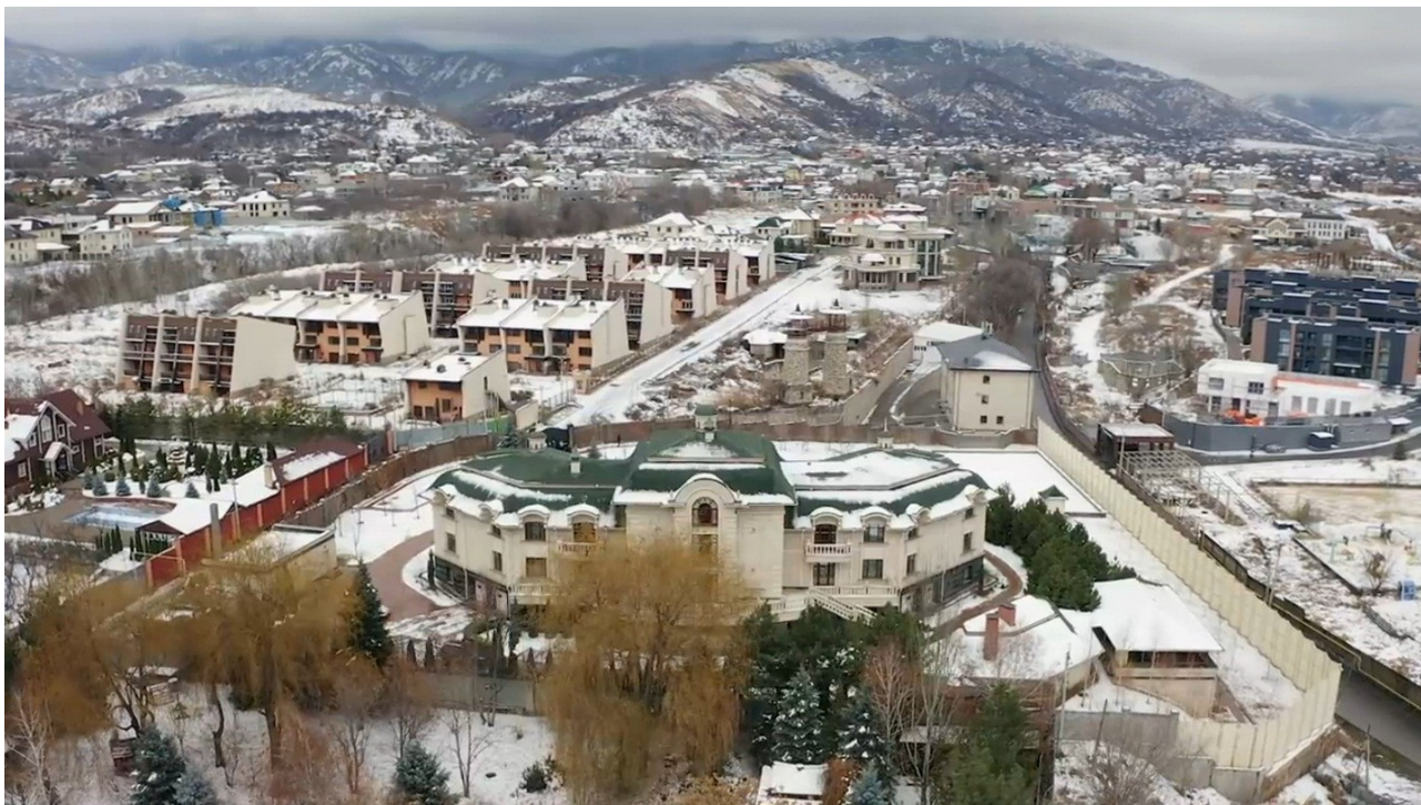
На фото: элитная резиденция в Алма-Ате «El Residence». (Из видео-фильма «Девчата — Казахстан. Орёл и решка»; январь 2021 г.).

К стати, несколько лет назад в обиход стало входить слово «корруптор» , однако, по смыслу это понятие не может означать простого взяточника, который, как говорится, «берёт на лапу» — он тогда и будет называться просто коррупционером или взяточником, а вот именно такого, который и является «инициатором коррупции» , да ещё и в крупном или особо крупном размере!