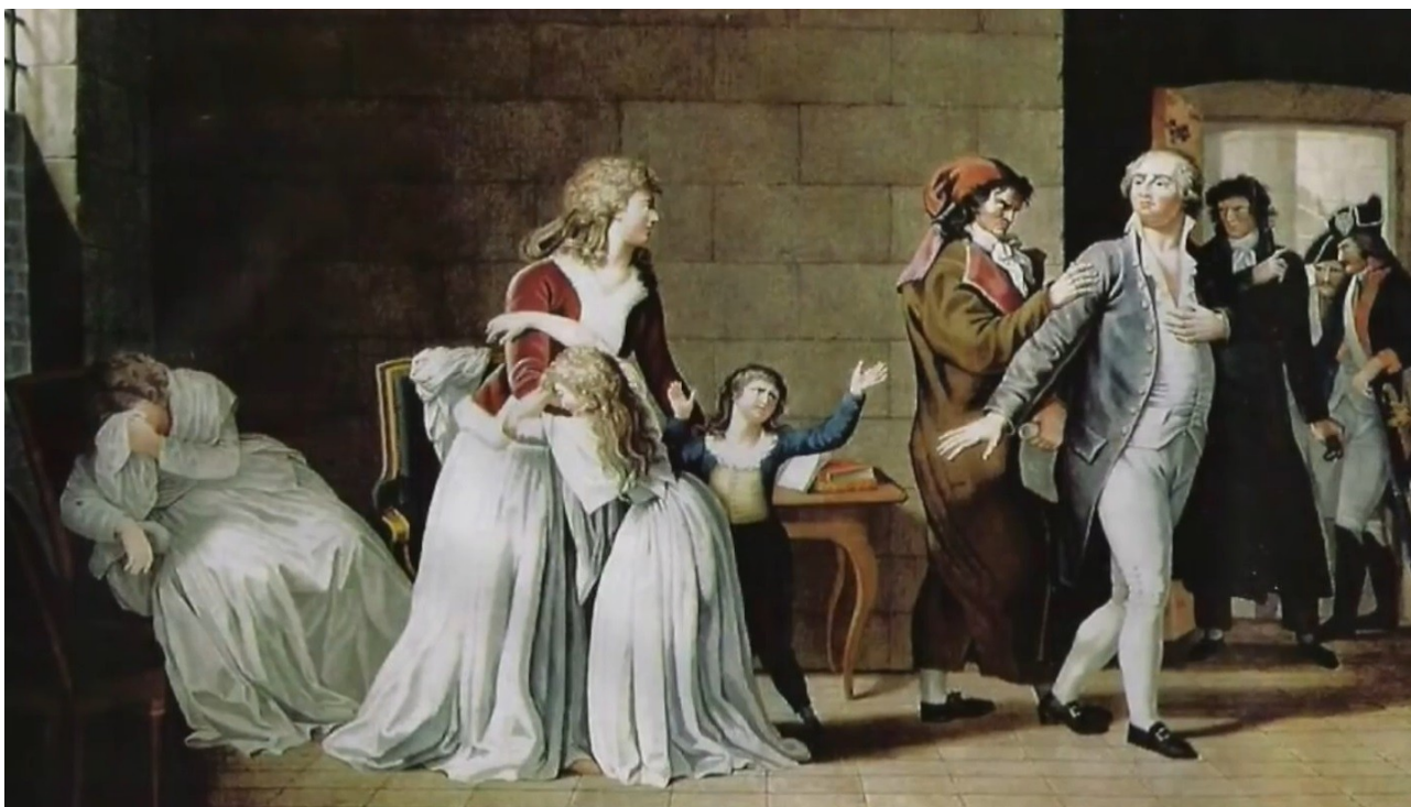
На фото-репродукции: Людовика XVI-го разлучают с женой и детьми. (Из видео-фильма «Королева Франции Мария Антуанетта»).

К стати, Царь или Король — это тоже коррупция , ибо для его приближённых (которые и делают его царём, королём) первостепенной важностью является сохранение за собой всего того, что они награбили, в том числе и самих людей, которых они силой и хитростью принудили сделаться рабами. То есть сохранение за самими собой рабов и рабынь (особенно — девочек-невольниц), что и должен, по идее, обеспечить и благословить главный грабитель и рабовладелец — царь или король.