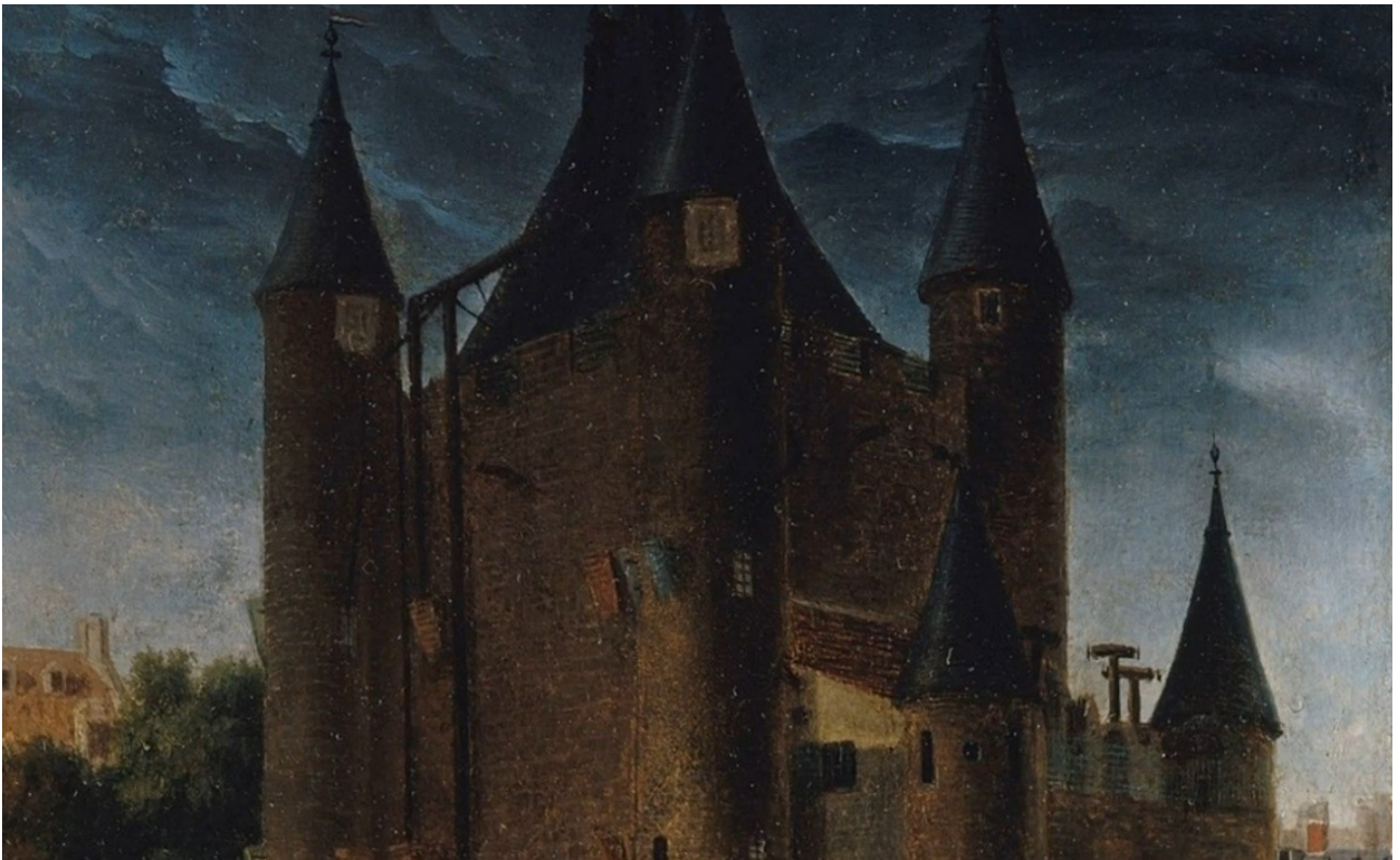
Le Temple — Последнее местопребывание высокопоставленных коррупционеров и предателей народа. (Фоторепродукция из видео-фильма «Почему казнили Марию Антуанетту»).

© Автор статьи: Преподобный Будда Денис (Крашенинников Денис Алексеевич), 15 мая 2024.