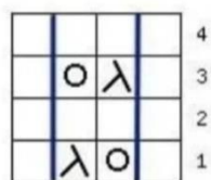
Схема ажурного узора: