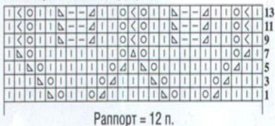
Схема узора «бабочка»