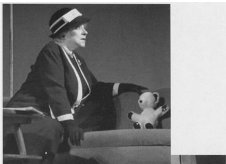
В спектакле Театра им. Моссовета «Эта странная миссис Сэвидж», 1966 год