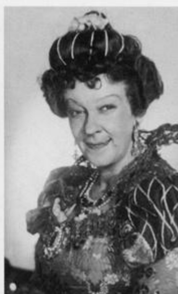
«Золушка». 1947 год