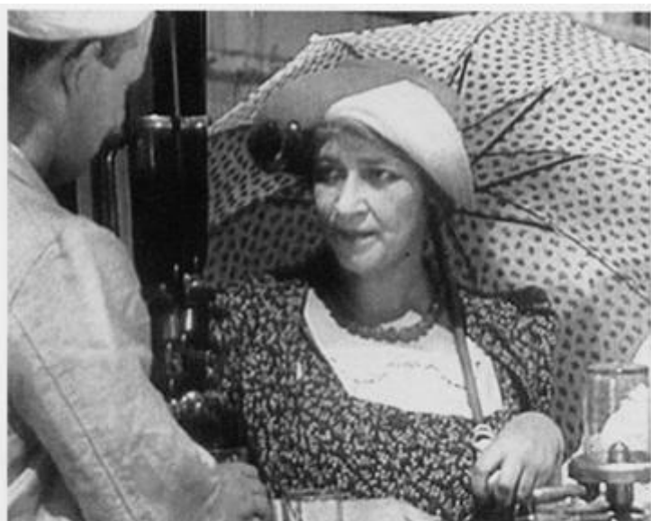
«Муж, не нервничай меня!» Эта фраза преследовала ее до конца жизни