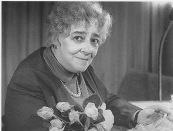
Цветы от поклонников