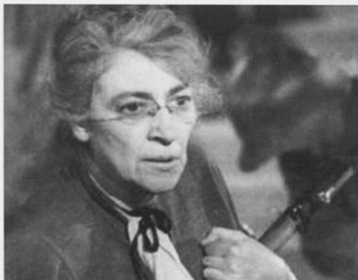
«Родные берега, или Три гвардейца». 1943 год