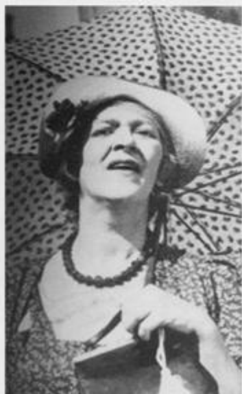
«Подкидывай». 1939 год