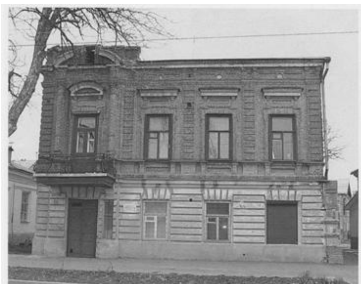
Дом, где жила Фаина Раневская в Таганроге