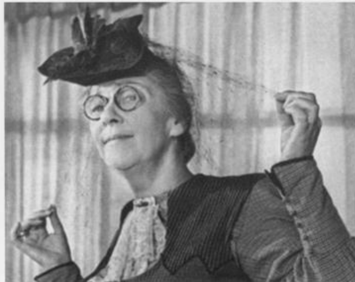
«Весна», 1947 год