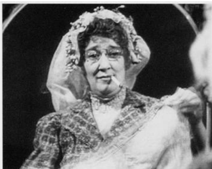
«Человек в футляре». 1939 год