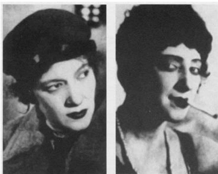
За шесть лет работы в провинциальных театрах России Раневская сыграла свыше 250 ролей