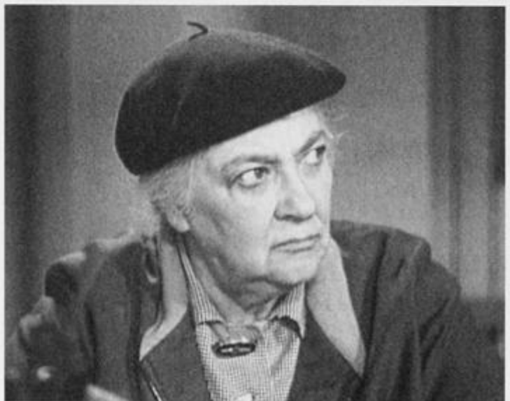
«Осторожно, бабушка!», 1960 год