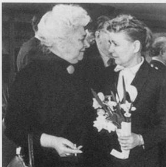
С Екатериной Фурцевой