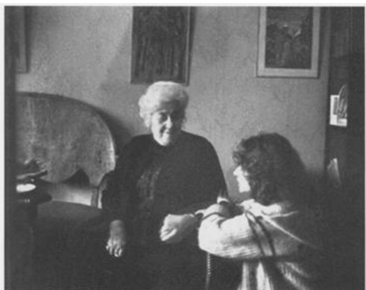
Фаина Раневская у себя дома