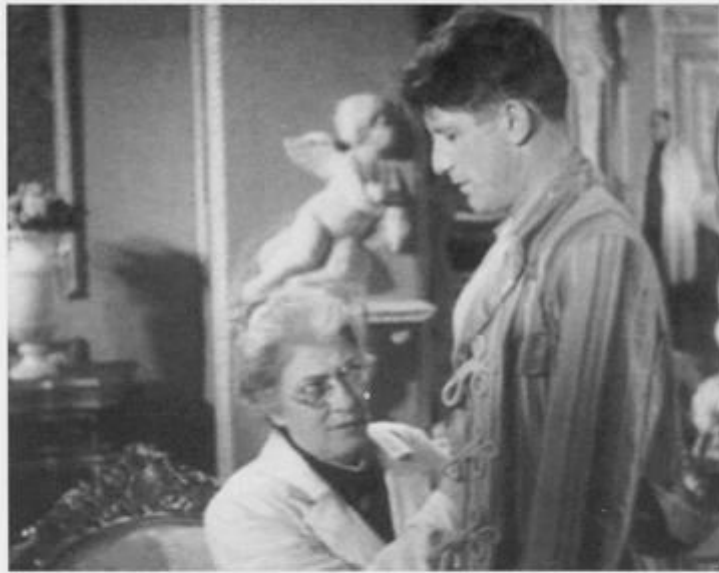
«Небесный тихоход», 1945 год