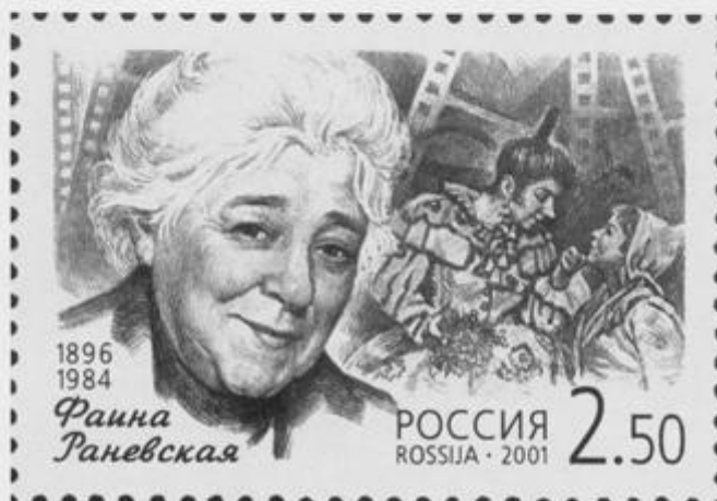
Почтовая марка, выпущенная к 105-летию великой актрисы