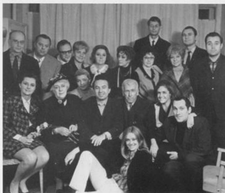
Участники спектакля «Дальше - тишина»