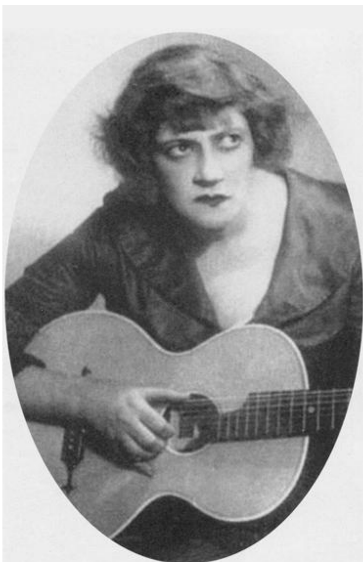
Одна из первых ролей в Москве. Раневская в роли Зинки в театральной постановке Александра Таирова «Патетическая соната», 1931 год