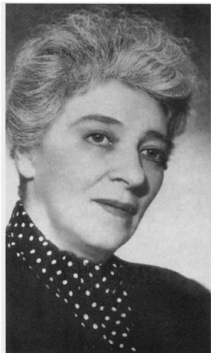
Начало 50-х годов