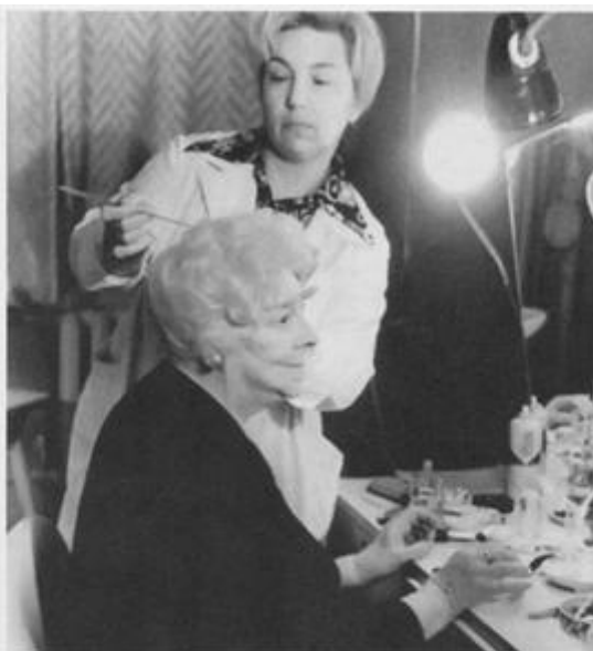
Перед выходом на сцену и после спектакля