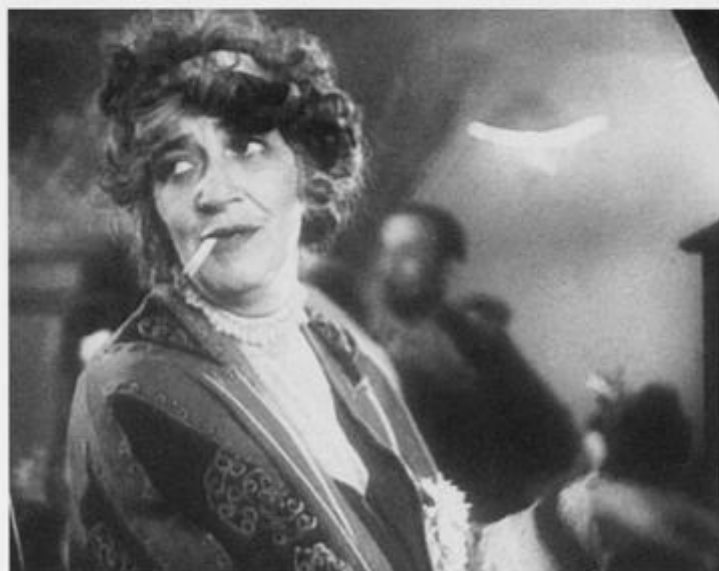
«Александр Пархаменко». 1942 год