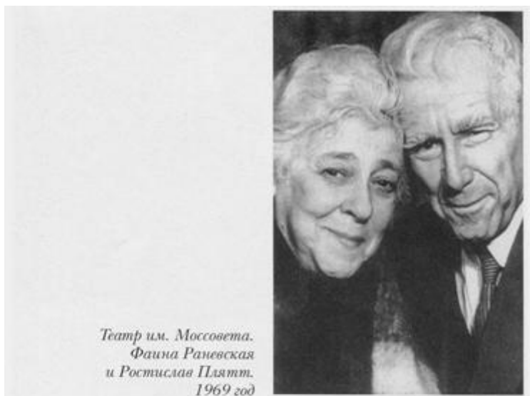
Театр им. Моссовета. Фаина Раневская и Ростислав Плятт. 1969 год