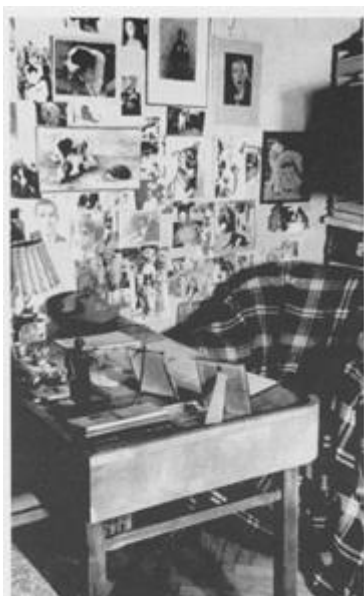
Рабочий стол в кабинете