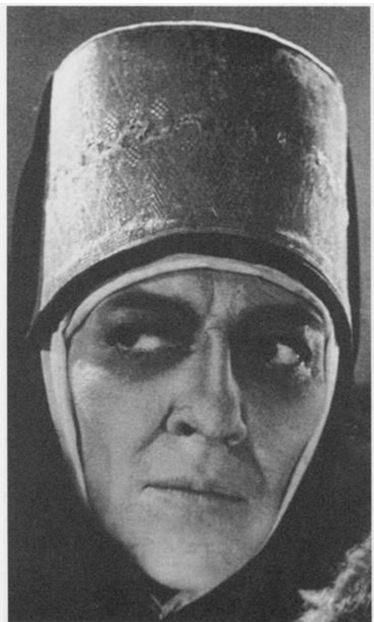
Пробы на роль Ефросиньи Старицкой