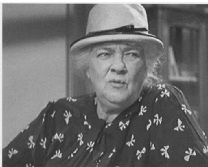
Кадр из сатирического киножурнала «Фитиль»