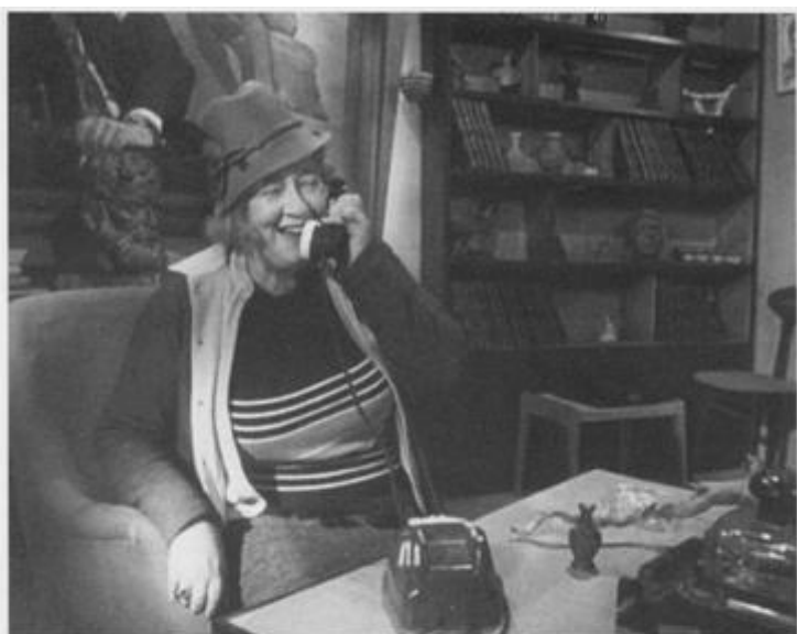
«Легкая жизнь». 1964 год