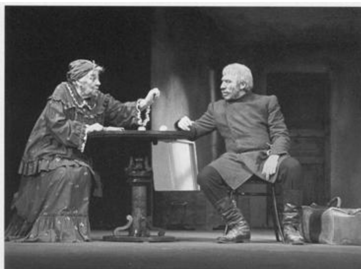
Спектакль «Правда хорошо, а счастье лучше». Театр им. Моссовета. 1981 год