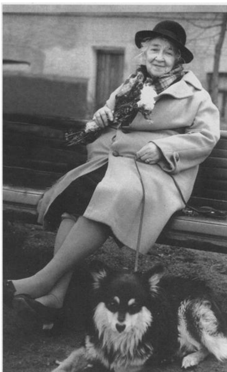
С любимым псом Мальчиком