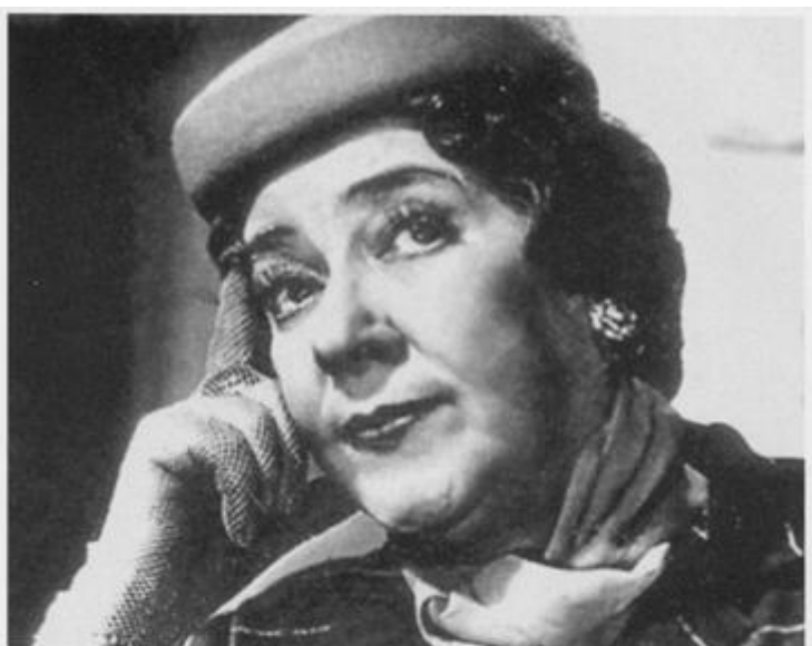
«Девушка с гитарой», 1958 год