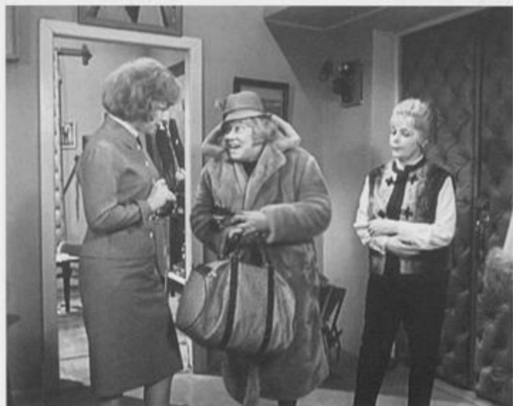
Фаина Раневская – Маргарита Ивановна, «Королева Марго»