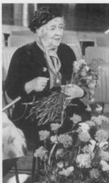
Встреча со зрителями