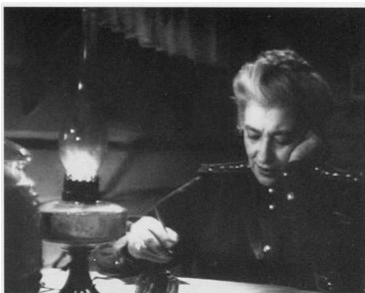
«Рядовой Александр Матросов». 1947 год