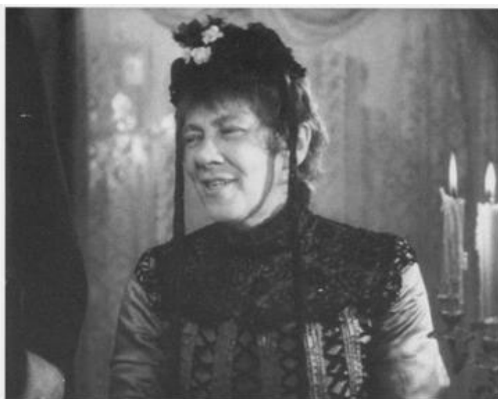
«Свадьба». 1944 год