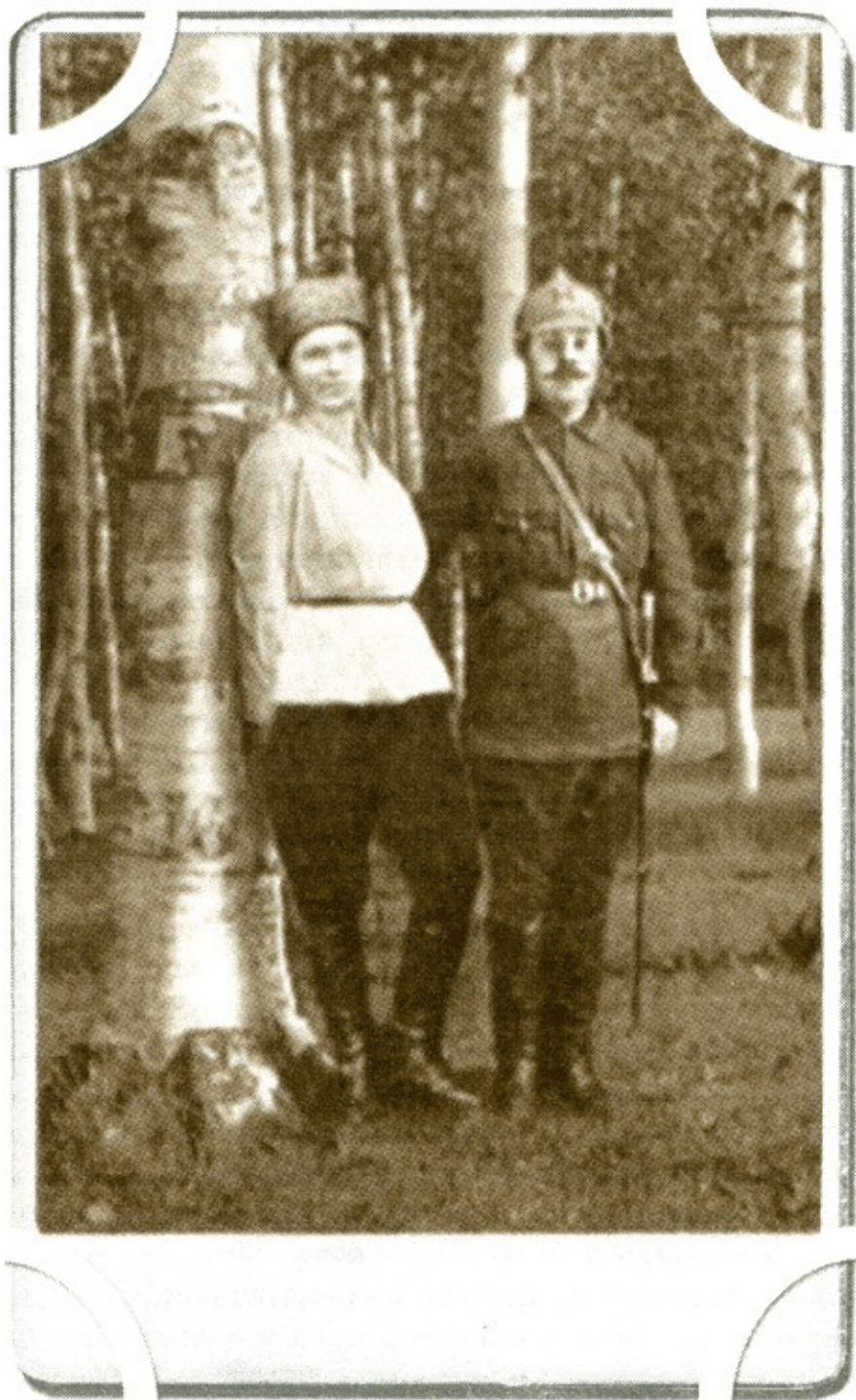
(Из семейного фотоальбома)