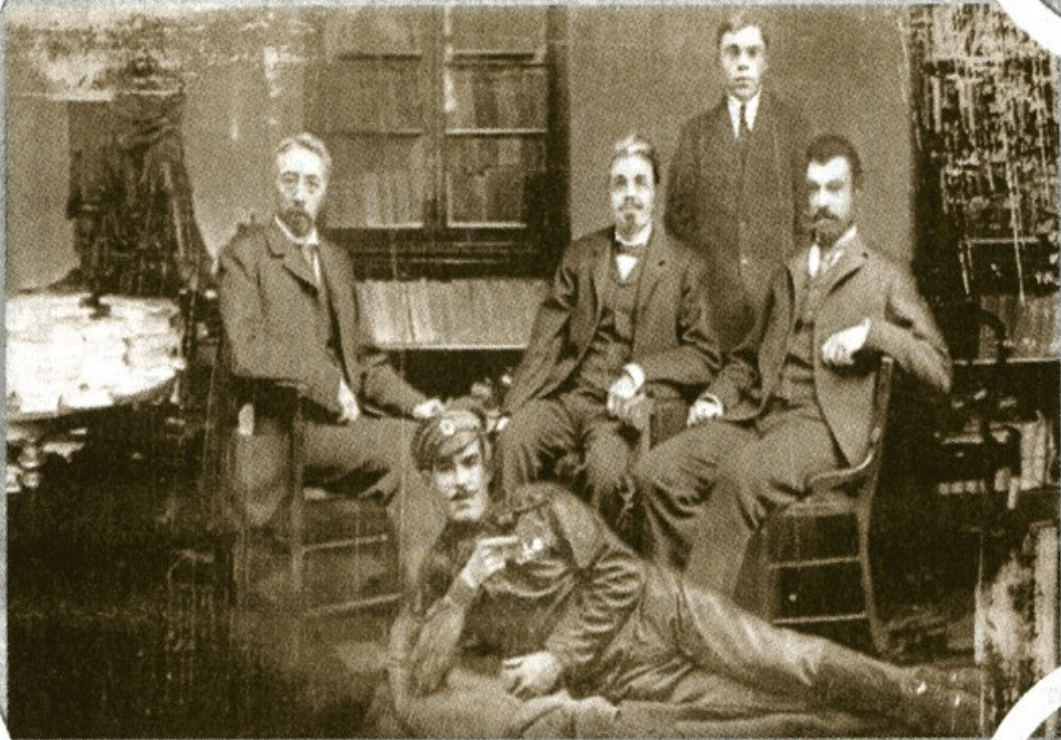
(Из семейного фотоальбома)

Сегодня я уже не представляю, как обходился прежде без всех этих понятий. Мне кажется, что они существовали всегда. Иногда в разговоре с кем-нибудь они сами соскальзывают у меня с языка, и я удивляюсь, что собеседник меня не понимает.