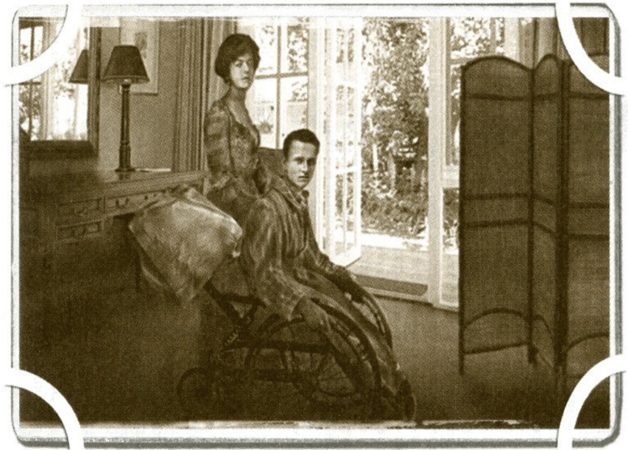
(Из семейного фотоальбома)

И тем не менее, сквозь кошмар и хаос, я вижу некий важный прорыв в нашем коллективном сознании. Заключается он в том, что панический лозунг Достоевского «если Бога нет, всё дозволено» уже не кажется человечеству неоспоримой истиной. Слово «Бог» не используется ни в Декларации ООН, ни в конституциях большинства демократических государств. Оказывается, мы и без веры в Страшный Суд пришли к пониманию, что жить нужно цивилизованно, уважая себя и окружающих, самосовершенствуясь – то есть по законам аристократии. Не из страха перед загробным наказанием, а по внутреннему убеждению.