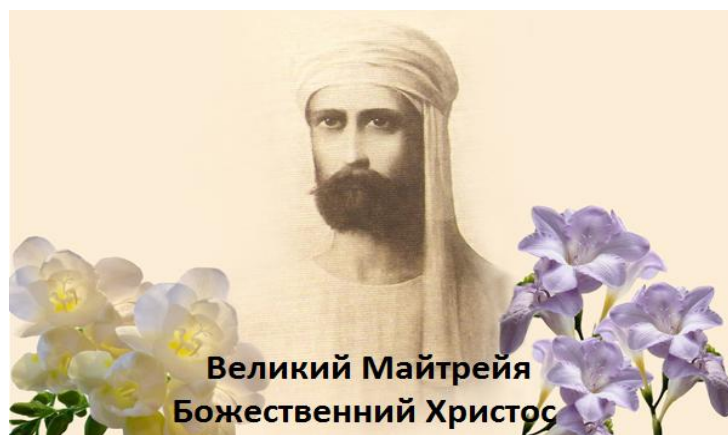
Великий Майтрея Божеественний Христос Всевишній, Батько Всесвіту, Создатель і Творець

Сказано: "Майте кожен Вчителя на Землі". Великий Владика нашої Сонячної Ієрархії (Логос) є нам дійсним Богом і Батьком, через Його велику турботу, Любов і допомогу людству. Лише дух, пройшовши незлічені форми і існування, може накопити досвід, без якого немає розпізнавання, думки, творчості. Як свідчать всі східні учення: "Немає бога, який не був би людиною, всі боги повинні пройти через еволюцію людини". Чим вище Дух, тим більше втілень. Дорога Виходження Великого Майтреї, - три тисячі втілень! Коли говориться