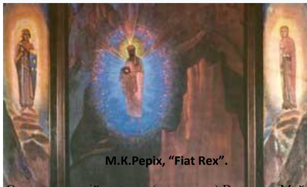
М.К.Реріх, "Fiat Rex".

Росія є Вісь Світу і так званий Пуп Землі, теж знаходиться в її межах. Сама Священна Шамбала відноситься багатьма Тибетом і монголами в Росію і до Росії, і в цьому полягає великий Символ. «Російський народ зберігає в собі природну культурність, бо характер його склався на азіатських просторах з накопичень Сходу, ... бо з Азії завжди приходив, і буде приходити Світло до кінця нашого циклу» Сердечно спрямовуйтеся до Великого Владика.