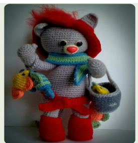
КОТИК ТИШКА-РЫБАК 24.09.2016