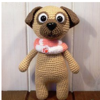
ЖИВОТНЫЕ ДОМАШНИЕ МОПС АРЧИ АМИГУРУМИ