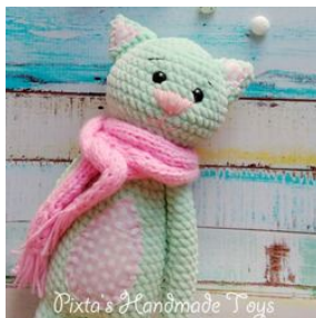
КОТИК МЯКИШ АМИГУРУМИ 11.03.2017