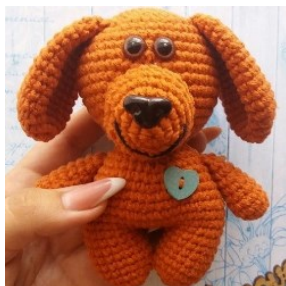
СОБАЧКА МАЛЫШ АМИГУРУМИ 15.07.2017