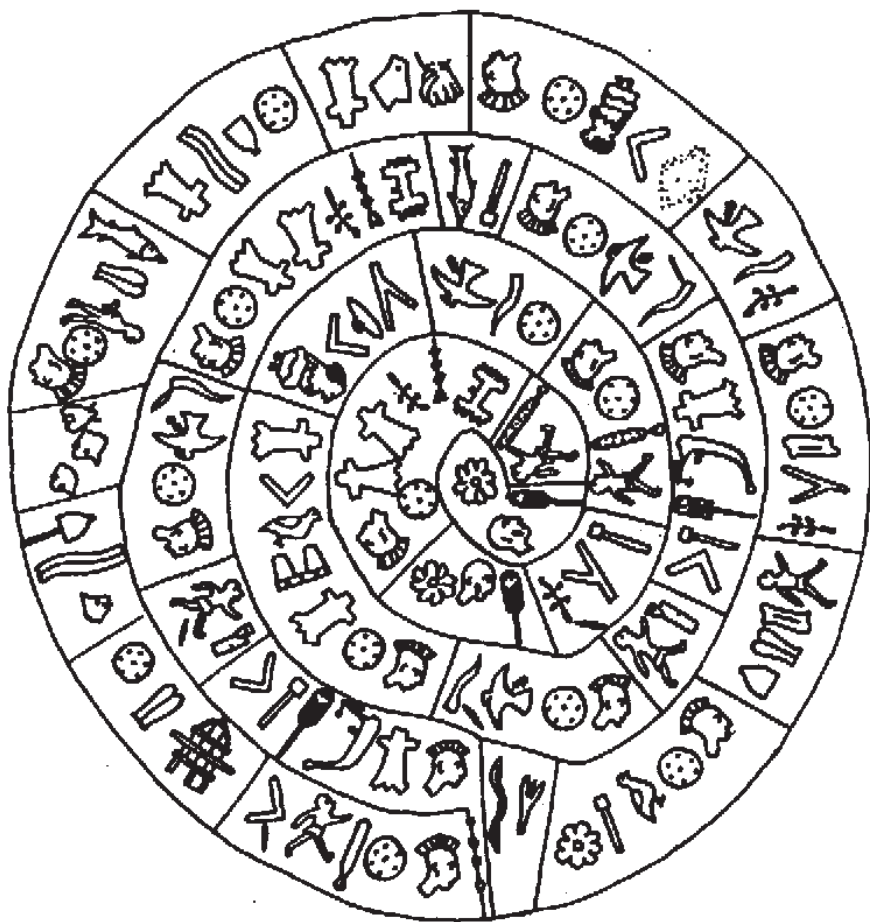
Фетский диск, сторона А

Горести прошлые не сочтешь, однако горести нынешние горше. На новом месте вы почувствуете их. Все вместе. Что вам послал еще господь? Место в мире божьем. Распри прошлые не