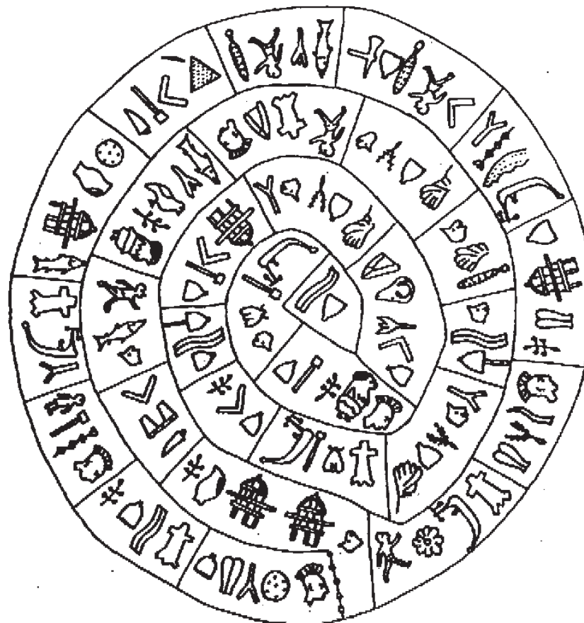
Фетский диск, сторона Б

Будем опять жить. Будет служение богу. Будет все в прошлом – забудем, кто есть мы. Где вы побудете, чада будут, нивы будут, прекрасная жизнь – забудем, кто есть мы. Чада есть – узы есть – забудем, кто есть. Что считать, господи! Рысиюния чарует очи.