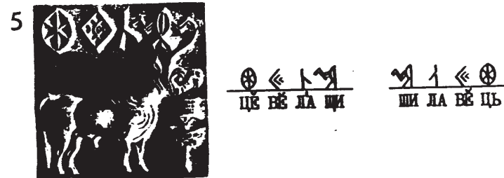
Составлена Г. С. Гриневичем