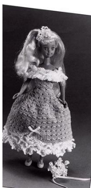
Младшая подружка невесты

Надеть платье на куклу. Обернуть ленточку шириной 1,2 см вокруг талии куклы и завязать бантом на спинке.