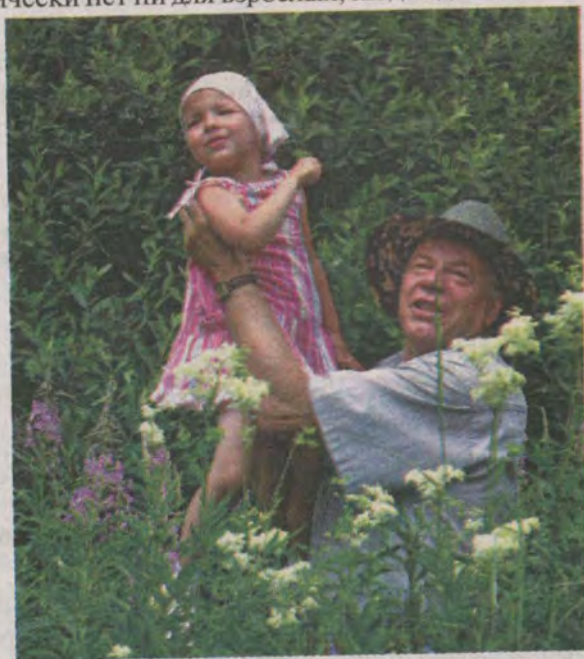
В зарослях таволги

дует употреблять при запорах. Других противопоказаний практически нет ни для взрослых, ни для детей.