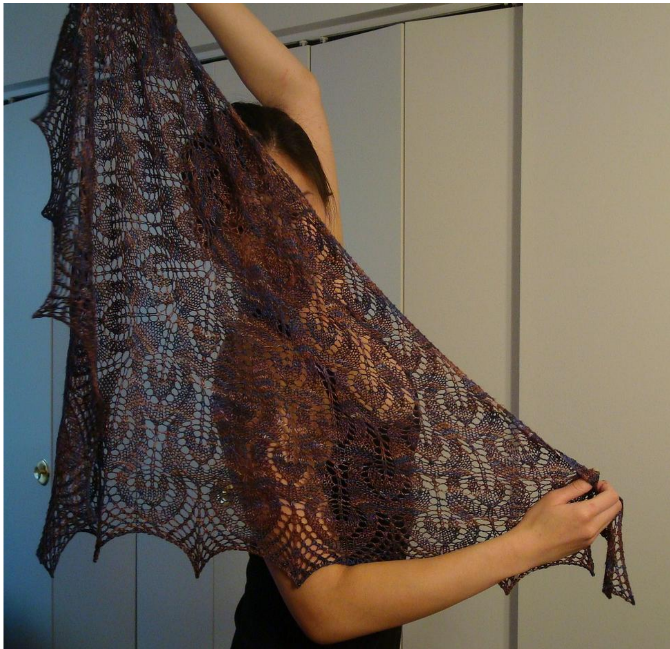
Гейл с центральной петлей

Добавление центральной петли. Никто не запрещает набрать 5 петель вместо 4-х и в дальнейшем вязать среднюю петлю скрещенной лицевой в лицевых рядах, и изнаночной в изнаночных рядах и тем самым разбить два центральных накида, из-за которых образуются большие отверстия.