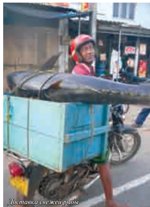
Доставка свежей рыбы

— Дело в политической и экономической обстановке, мешающей работать в сфере туризма. Были годы, когда туристы практически перестали приезжать в Шри-Ланку из-за гражданской войны. В 80-х годах на острове активно отдыхали европейцы — из Бельгии, Нидерландов, Франции, Италии, Финляндии и Поль-