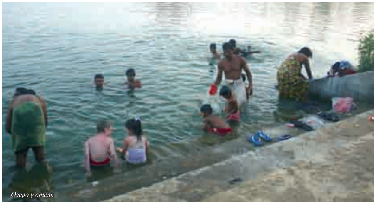
Озеро у отеля